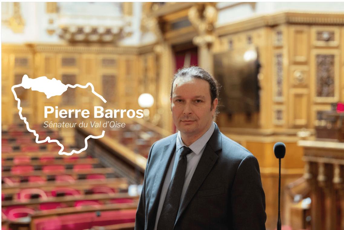
Pierre Barros Sénateur du Val d'Oise

UN TERRITOIRE, NOS COMBATS, POUR L'AVENIR